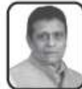
શ્રી જયંતીબાઈ ચિરજી સત્રા ભચાઈ