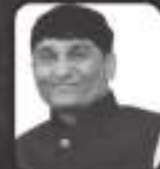
શ્રી ઢસમુખ લખદીર ડાડા ઢલરા